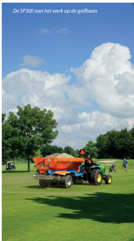
De SP300 aan het werk op de golfbaan