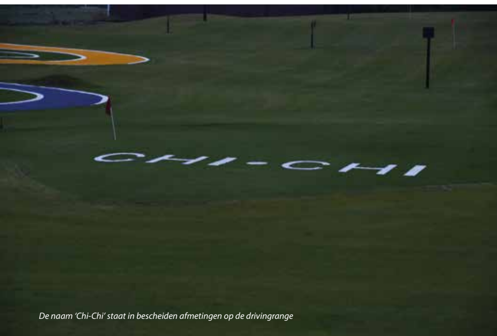
De naam 'Chi-Chi' staat in bescheiden afmetingen op de drivingrange

drivingrange. Bunkers waarin je bal kan komen te liggen, zijn hier niet aangelegd. Daarvoor in de plaats zijn er wel een heleboel targets om zowel de swing als het chippen te oefenen. Borden die de afstanden aangeven, zie je hier niet. Die kan de golfer immers op de led-display naast zich aflezen. Naast de steunpalen van de radarantennes staat er ook nog een tiental palen met led-verlichtingsarmaturen op het veld van de drivingrange. Deze golfamusementbaan zal namelijk ook 's avonds in gebruik zijn. In de toekomst moet ik er uiteraard voor zorgen dat het gras rondom die vele targets, palen en