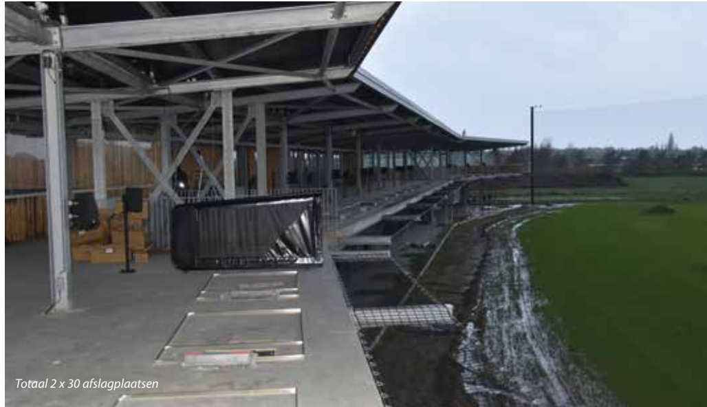
Totaal 2 x 30 afslagplaatsen

Het afslaggebouw, met in totaal zestig afslagplaatsen, huisvest eveneens de clubaccommodatie, een restaurant, een pannenkoekenrestaurant, een af te huren businessroom en een groot terras. Daarnaast kan de wand tussen het restaurant en de golfers die hun swing oefenen, volledig opengezet worden. Dit moet voor meer interactie tussen het swingende en tafelende publiek zorgen. Ten westen naast het afslaggebouw biedt een kunstgrasmat mogelijkheden voor golfers om het chippen te oefenen. Daartoe zijn speciale kunststof targetvlakken in frisse kleuren aangelegd op de drivingrange. De in totaal zestig afslagplaatsen op twee niveaus zijn aan de zijkant voorzien van een goed leesbare led-displaybalk. Deze geven de golfer informatie over het aantal geslagen ballen, de gerealiseerde afstand en de balsnelheid. Een mechanisme in de vloer onder de kunststof afslagmat zal er straks voor zorgen dat er na een afslag steeds weer een nieuwe bal op de tee komt te staan. 'De verwachting is,' zo vertelt Oskam, 'dat er op de drukste dagen circa vijftigduizend ballen verzameld moeten worden. Waarschijnlijk gaan we dat eerst handmatig doen, maar uiteindelijk zullen robots dat overnemen.'