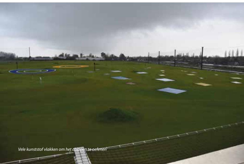
Vele kunststof vlakken om het chippen te oefenen

ante golfprofessional die veel gevoel had voor entertainment. Hij werd in 1935 in Puerto Rico geboren en heeft tientallen toernooizeges op zijn naam staan. Als mecenas financiert "Chi-Chi" Rodríguez nu bijvoorbeeld een school met meer dan tachtig leerlingen die uit kansarme situaties komen. Wij hebben hem persoonlijk gevraagd om zijn naam aan dit golfoefencentrum op te dragen. Daarbij deden we hem ook de toezegging om inkomsten, bijvoorbeeld afkomstig vanaf onze businessleden, te doneren aan zijn jeugdeducatiefonds in Tampa. De eerste cheque mocht ik zelf aan hem overhandigen en dat trof hem. Het is niet zonder reden dus dat je straks bij de inrichting van ons clubgebouw en op de menukaart Zuid-Amerikaanse aspecten terug gaat vinden. Wij zien golfen, net zoals "Chi-Chi" Rodríguez dat in zijn gloriejaren deed, als een stuk entertainment. Met het gebruik van zijn bijnaam hopen we dat ook zeker goed uit te gaan dragen.'