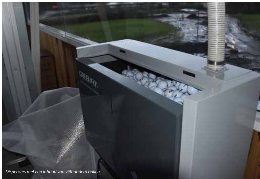
Dispensers met een inhoud van vijfhonderd ballen