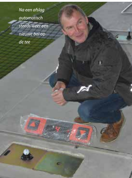
Na een afslag automatisch steeds weer een nieuwe bal op de tee

zo bijgevuld tot maximaal vijfhonderd ballen,' vertelt Oskam. 'Dit gebeurt zonder gebruikmaking van sensoren die de aantallen registreren. Zodra de band ook de laatste dispenser gevuld heeft aan het einde van de band, gaat de band in omgekeerde richting lopen. Zodoende worden de dispensers waar alweer ballen bij kunnen, opnieuw helemaal gevuld. Aan het einde, als alles vol is, stopt het hele systeem. De frequentie van een nieuwe bevoorradingsronde kun je uiteraard instellen. Gebruikers van het systeem betalen hier straks per uur. Ze mogen in die tijd zoveel ballen afslaan als ze willen.'