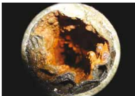
Conditie buizenstelsel 8 jaar na installatie zonder gebruik Aqua-4D.

De elektromagnetische behandeling, dat resetten dus, gebeurt op lage frequenties en bij een lage dosering. Toen het product enkele jaren geleden in de veehouderij op de markt werd gebracht meldde de leverancier trots: 'Eenmaal toegepast is binnen 6 tot 8 weken de waterleiding vrij van