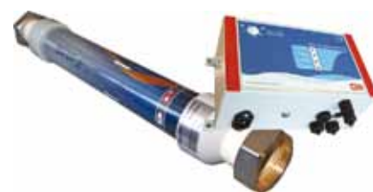
Aqua-4D werkt met straling, maar vraag niet hoe het werkt, maar het werkt.

'Wat de 4D technologie doet', vertelt Casper, 'is in feite het resetten en beïnvloeden van de krachten die een rol spelen in watermoleculen, zoals Van der Waalskrachten en bipolaire krachten. Hoe het werkt kan niemand precies zeggen,