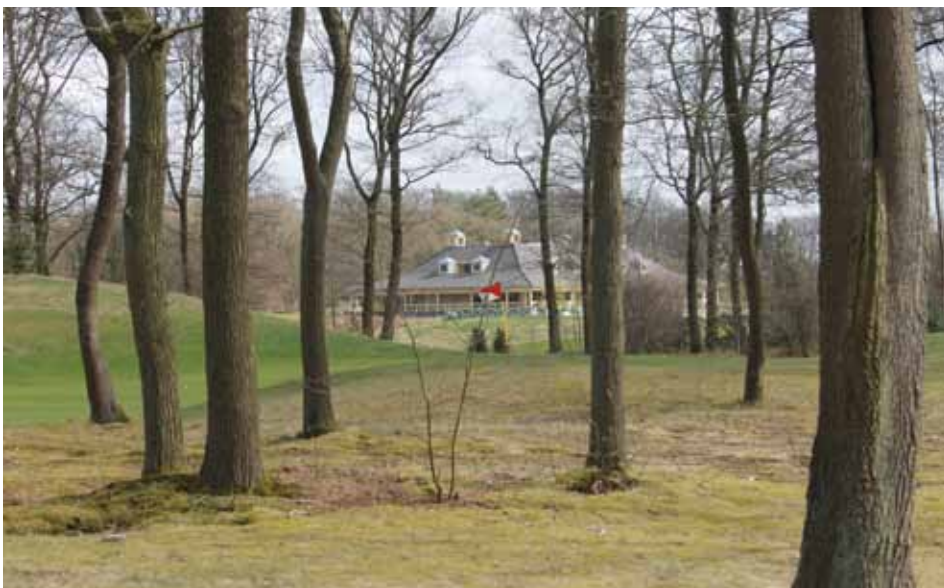
Dunningen zijn belangrijk om bomen de ruimte te geven en uit te laten groeien tot vitale bomen met een mooie groeivorm.

In 2016 wordt de balans opgemaakt. Hebben de inspanningen het gewenste resultaat opgeleverd? Dat kan alleen beoordeeld worden aan de hand van de cijfers die NLadviseurs heeft. Het doel was om ervoor te zorgen dat het bomenbestand vitaler zou worden. Samen met de boomspecialist wordt door het bedrijf een ronde gemaakt over de golfbaan om de bomen opnieuw te beoordelen op kwaliteit. De resultaten worden ingevoerd in GolfGIS en vergeleken met de resultaten van acht jaar geleden. De harde data vertellen dat de maatregelen en inspanningen in tijd, geld en mankracht duidelijk resultaat hebben geboekt. Zo is het percentage bomen met een goede vitaliteit gestegen naar ongeveer 45%. Het percentage slechte tot zeer slechte bomen is gereduceerd tot minder dan 5%. Met behulp van relatief weinig inspanningen is er een optimaal resultaat behaald.