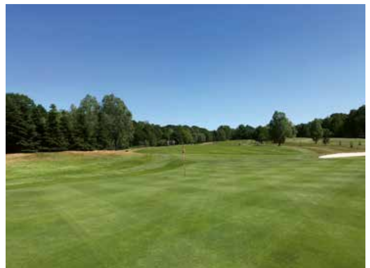
Green op golfbaan Welschap