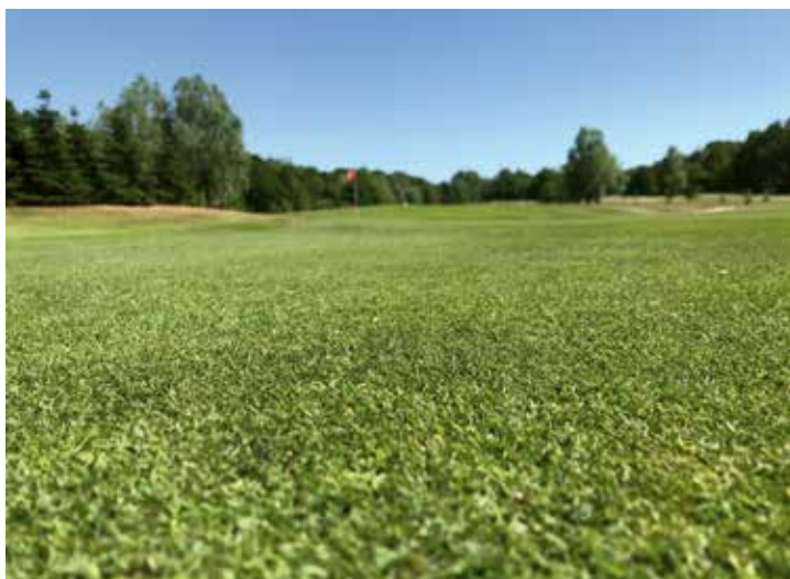
Close-up van de green

www.greenkeeper.nl/article/33746/grote-meerwaarde-struisgrassen-met-yellow-jacket-water-manager