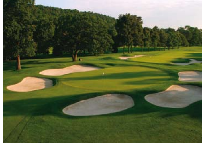
Holes 14 en 6 Lower

A.W. Tillingshast in 1942 werd hij opgevolgd door Robert Trent Jones en nu Rees Jones. Hij tekende de huidige renovaties in de voorbereiding op het US PGA Championship in 2016. Deze renovaties houden ongeveer het volgende in: verlengen van de baan door het aanleggen van enkele nieuwe back tees, het herpositioneren van bijna alle fairway-bunkers om ze weer 'in-play' te brengen en het smaller maken van de fairways. Daarnaast worden de gehele golf-rough en de greens surrounds opnieuw voorzien van veldbeemd-graszoden. Ook wordt tijdens deze werkzaamheden de drainage verbeterd. Daarnaast zijn bijna alle tees opnieuw bezod met kruipend struisgras en voeren we een intensief agronomisch programma uit om de groei van dit gras-