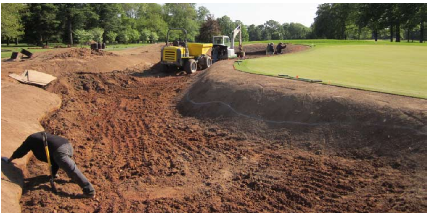
Bunker en green surrounds renovaties