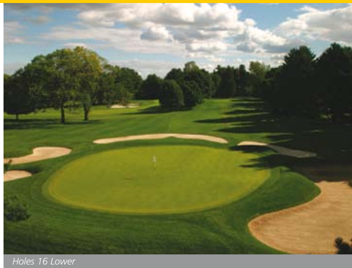
Holes 16 Lower

door hadden. Na een paar jaar kon hij de uren niet meer verantwoorden in zijn budget en overtuigde hij zijn toenmalige baancommissaris ervan gedurende daglicht te doen. Het werd verantwoord onder de noemer van 'de baan weer in originele staat terugbrengen'. In totaal zijn er ongeveer 5.500 bomen gekapt op Oakmont. Hierdoor is de kwaliteit van de golfbaan en de grasmat drastisch verbeterd. Op Baltusrol gaat het er iets minder extreem aan toe, maar ook hier staan rond de greens en tees bijna geen bomen meer die het zonlicht belemmeren. Zoals Kuhns mij liet zien heeft dit binnen enkele jaren al een flinke uitwerking gehad op het aandeel struisgras in bepaalde greens ( Poa annua is 40x meer efficiënt in het fotosynthese-proces dan kruipend struisgras).