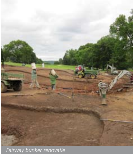
Fairway bunker renovatie

den beschikbaar. Mijn ervaring is dat de verwachtingswaarde van de golfers, waaronder de lage schimmeldruk-drempel in combinatie met het moeilijke klimaat om gras te groeien, de reden is dat we hier zo'n intensief onderhoudsprogramma volgen.