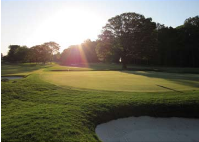
Hole 11 Upper