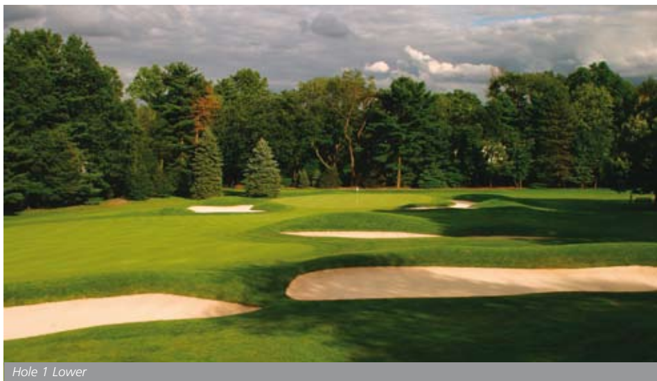
Hole 1 Lower

De voornaamste ziekten in de zomermaanden zijn: Sclerotinia homeocarpa (dollar spot), Colletotrichum graminicola (antrachnose) en Rhizoctonia solani (brown patch). We worden ook geplaagd door meerdere insectensoorten. Hiertegen voeren we een intensief programma met pesticiden, waarbij we deze weloverwogen, gereguleerd en met verstand van zaken toepassen. De beginselen van planmatige ziekten- en plagenbestrijding, die cultuurmaatregelen en pesticidengebruik integreert, houden we ook streng aan. Niet zomaar domweg en onbeperkt spuiten dus, zoals de perceptie van diep groene Amerikaanse golfbanen misschien soms is! Wel hebben we hier een ruimer arsenaal aan pestici-