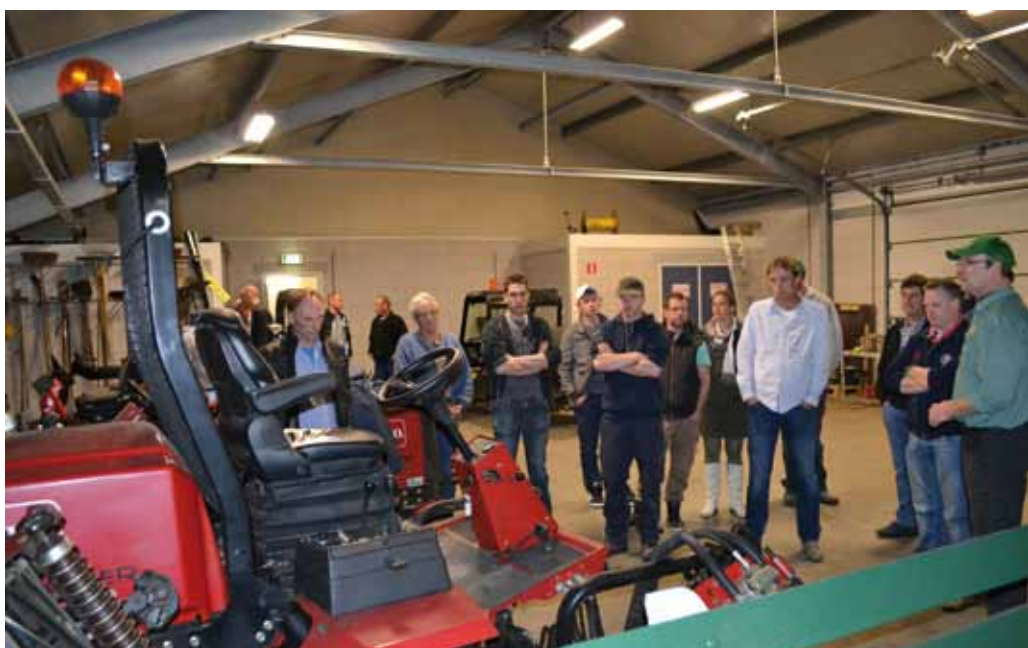
Een kijkje in machineloods van de Edese Golfclub. Hier staan ook machines die Heymans Sport & Groen inzet op de p&p-baan.