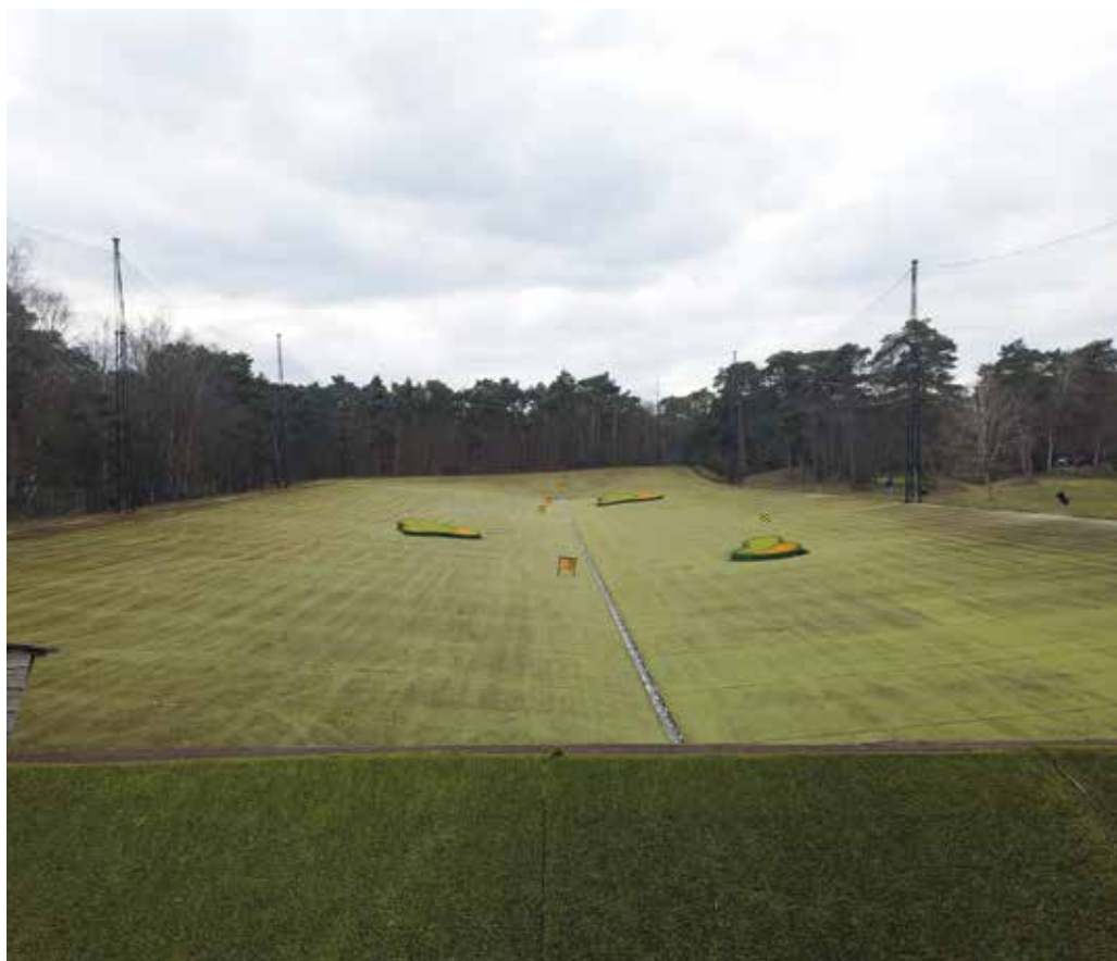
De drivingrange is bedekt met tapijt. In het midden de band die de ballen terugbrengt