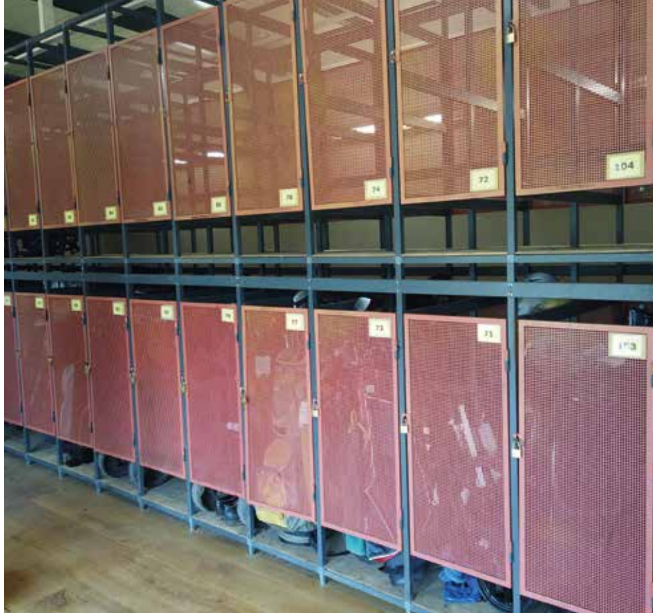
De lockers zijn overgenomen van Welschap en stonden ooit nog op de Eindhovense

'niet zo slecht'. Alleen twee greens die recent gerenoveerd zijn, vragen meer aandacht. 'Daar was een soort brekerzand gebruikt in de top laag. Als je een hole stak, liep het zand er zo uit. Het vraagt veel aandacht, bemesting en water om die weer goed te krijgen, maar dat gaat lukken.'