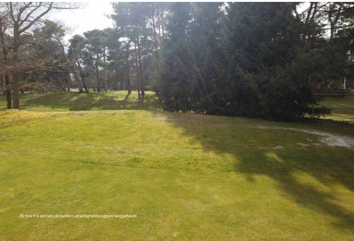
Bij hole 9 is een van de bunkers uit veiligheidsoogpunt weggehaald.

Verder vallen de vele bomen op die rond en in de baan staan, van jonge eiken tot grove dennen van 100 jaar oud. Dat is bij het onderhoud nog weleens lastig, zegt De Jager. 'We hebben erg veel schaduw hier, waardoor de