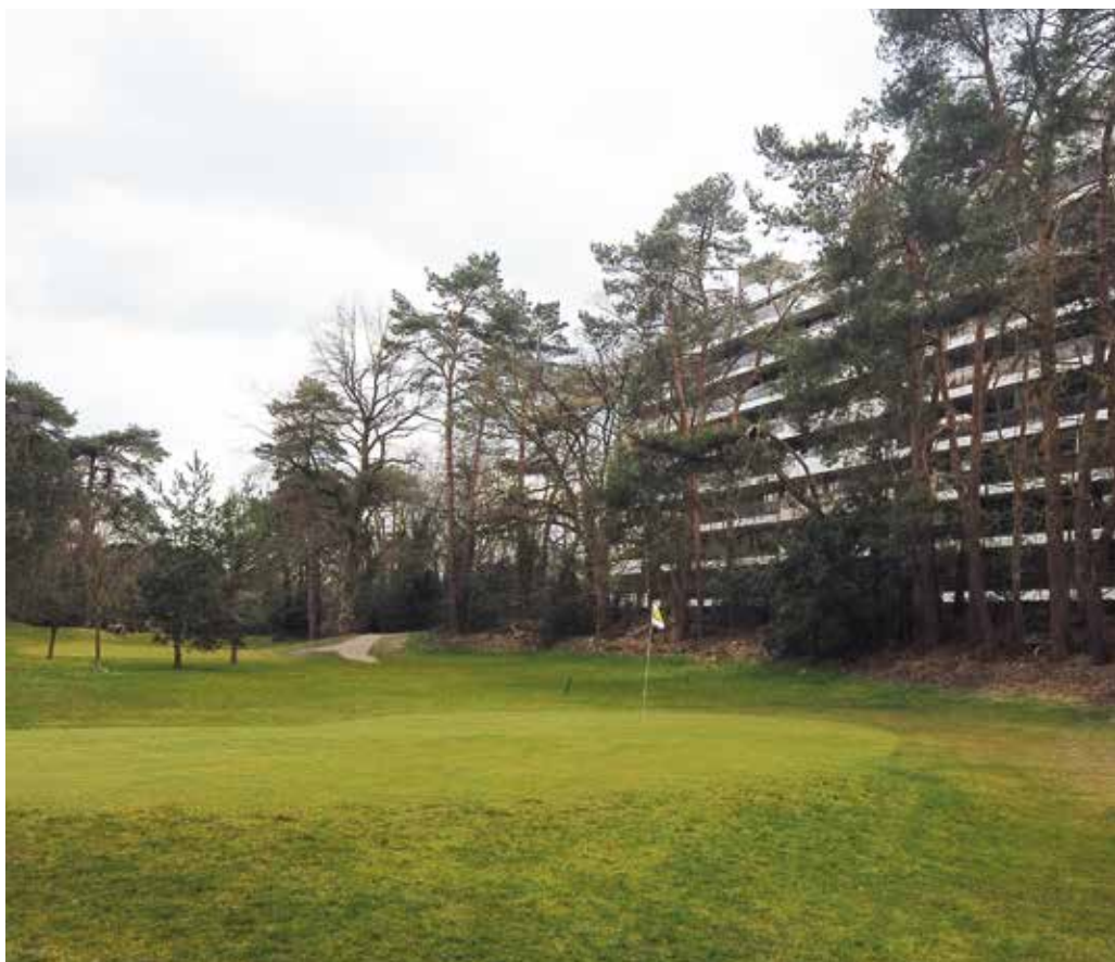
Kenmerkend voor deze baan is de hoogbouw op de achtergrond. Hier de green van hole 7