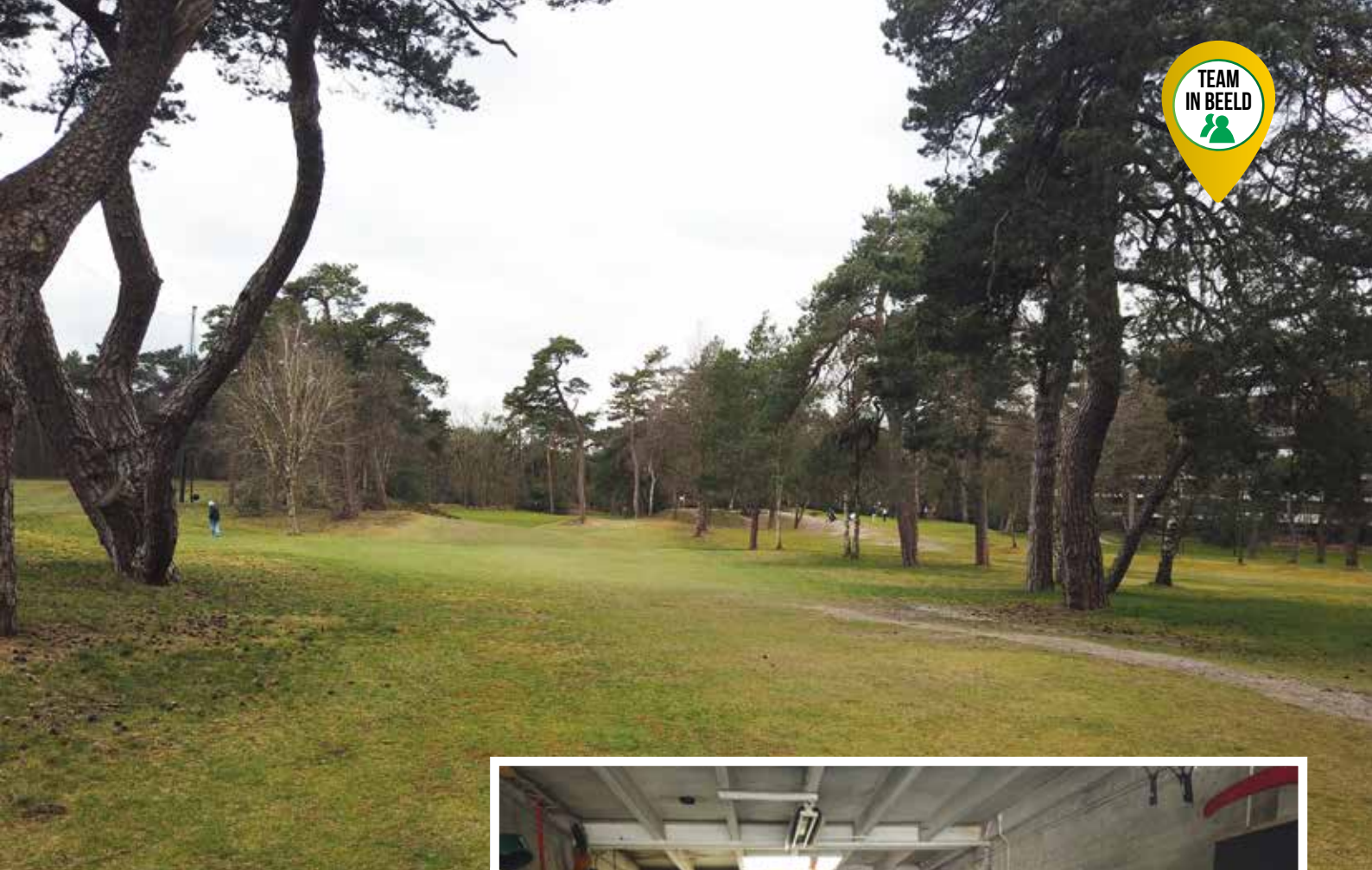
Zowel in als rond de baan staan veel bomen.

baan lang nat blijft. Maar bomen kappen kan eigenlijk niet vanwege de veiligheid. Dit is een klein terrein en je hoort hier veel fore . We hebben wel een dikke bomenrij weggehaald om wat meer licht te creëren, maar je kunt hier niet zomaar je gang gaan.' Ons bezoek valt midden in de winter en dus vallen de flatgebouwen op. De Jager is daar inmiddels aan gewend en het heeft volgens hem ook zijn charme. 'Ik zie dit als een stukje mini-Engeland. Daar heeft ook elk dorp zijn eigen golfbaan, soms midden in een woonwijk. Ons clubhuis is een Engelse pub. Die sfeer willen we juist vasthouden.'