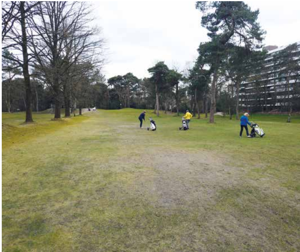
Met negen par-3-holes is het altijd druk in de baan.