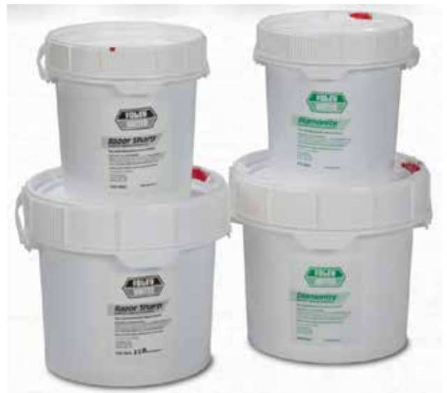
Er zijn diverse soorten backlappasta.