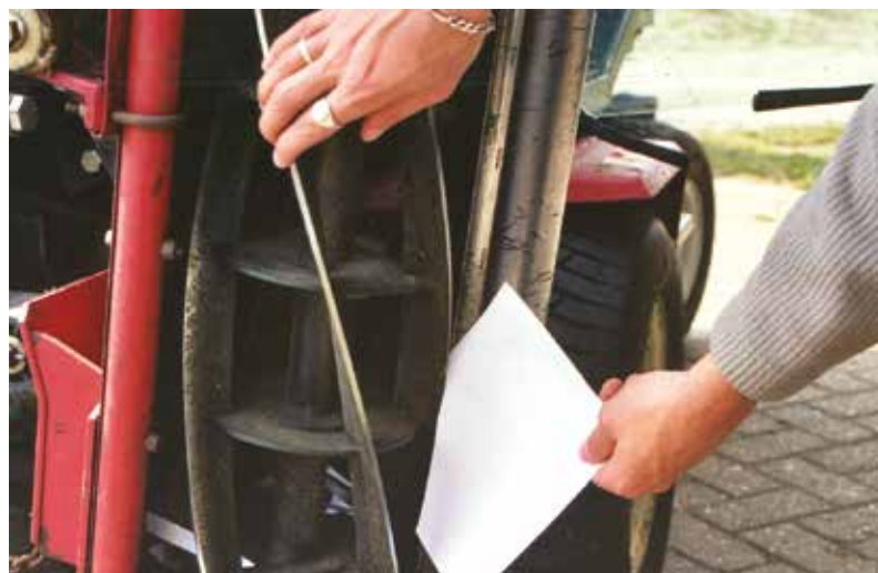
Een eenvoudige truc om te controleren of de messen weer scherp zijn.