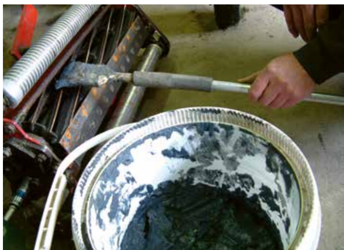
Backlappasta breng je voor het backlappen aan op de maaimessen.