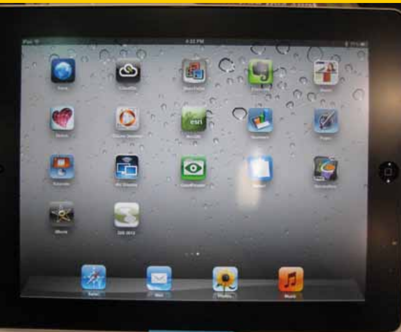
Apps voor greenkeeping

konden belangstellenden tevens de in de inleidingen gepresenteerde apps voor management en onderhoud van de golfbaan uitproberen. Programma-overzichten van het GCSAA-congres en het NGCOA-congres zijn te vinden op respectievelijk www2.gcsaa.org/conference en www.ngcoa.org/conference . In het NGCOA-overzicht zijn ook de inleidingen van de 'answers on the hour' en 'tech tips on the half' opgenomen.