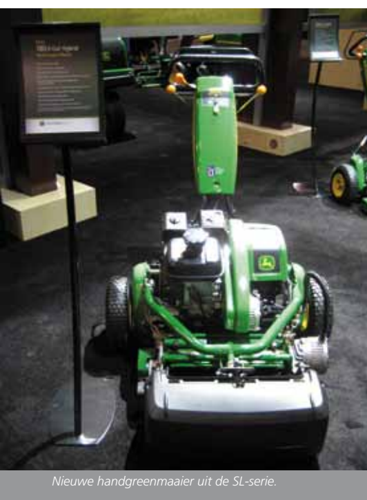
Nieuwe handgreenmaaier uit de SL-serie.

konden belangstellenden tevens de in de inleidingen gepresenteerde apps voor management en onderhoud van de golfbaan uitproberen. Programma-overzichten van het GCSAA-congres en het NGCOA-congres zijn te vinden op respectievelijk www2.gcsaa.org/conference en www.ngcoa.org/conference . In het NGCOA-overzicht zijn ook de inleidingen van de 'answers on the hour' en 'tech tips on the half' opgenomen.