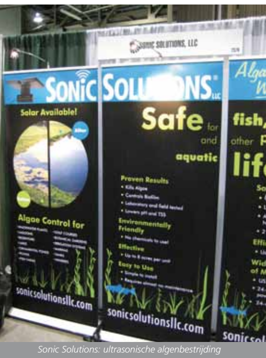
Sonic Solutions: ultrasonische algenbestrijding

John Deere presenteerde de nieuwe XUV 825i, een heavy duty utility vehicle, zoals ze het zelf noemen. Het is een monster met 50 pk en een topsnelheid van zo'n 70 km per uur, eventueel ook als 4-wheel-drive te leveren. Misschien toch een beetje te veel van het goede voor de gemiddelde golfbaan in Nederland? JD had voorts een nieuwe handgreenmaaier SL-serie, maar dat waren eigenlijk de C-modellen, waar nu ook het speedlink hoogte-instellingssysteem aan is toegevoegd.