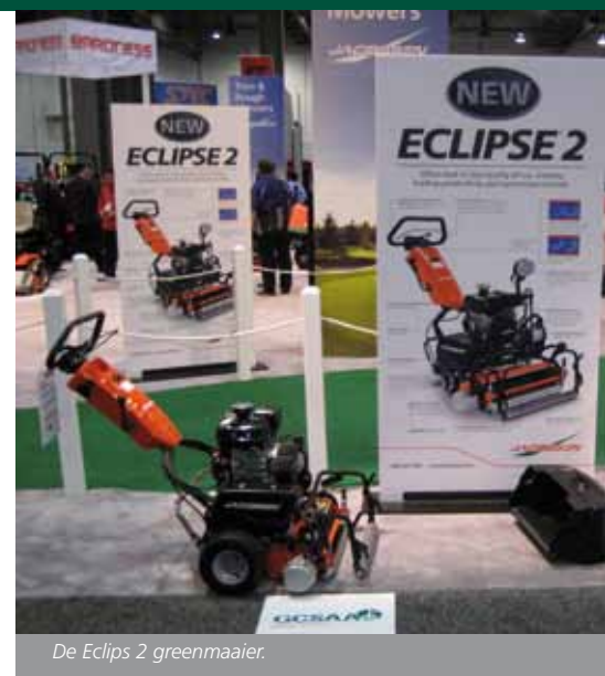
De Eclips 2 greenmaaier.

Nieuw en aanvullend op de congressen waren de op de Golf Industry Show door NGCOA en GCSAA georganiseerde 'answers on the hour' en 'tech tips on the half': een groot aantal korte inleidingen over verschillende onderwerpen, die op twee plaatsen op de beursvloer werden gehouden. Daarnaast was ook een zogenaamde test drive technology center een nieuw initiatief op de beurs. In de stand werden nieuwe technische hulpmiddelen getoond en uitgelegd door een uitgebreide staf van medewerkers. Hier