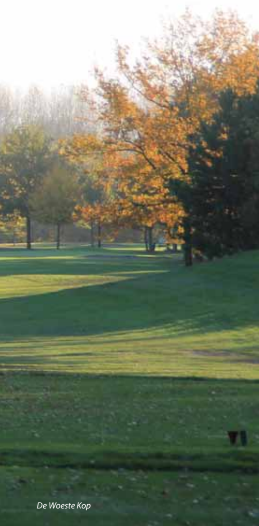
De Woeste Kop

Maar wat haalt de golfclub zich eigenlijk op de hals? Is zo'n GEO-traject niet heel intensief en levert het wel op wat het belooft? Ja, dat traject is inderdaad intensief, maar uiteindelijk levert het u waarschijnlijk zelfs meer op dan beloofd. Hoe werkt dat?