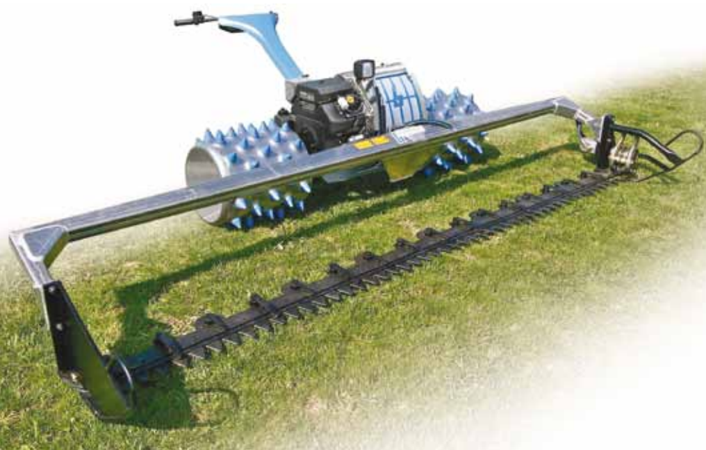
Een werkbreedte van maximaal 6.00 meter.