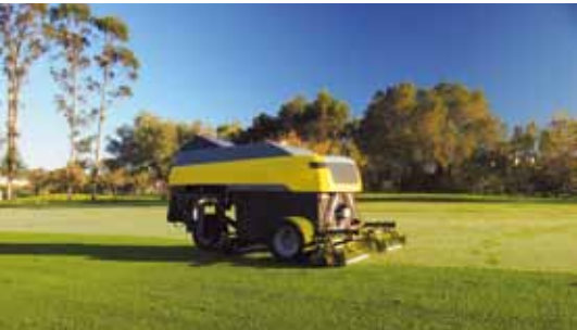
De Turflynx F315 wordt geproduceerd in Portugal