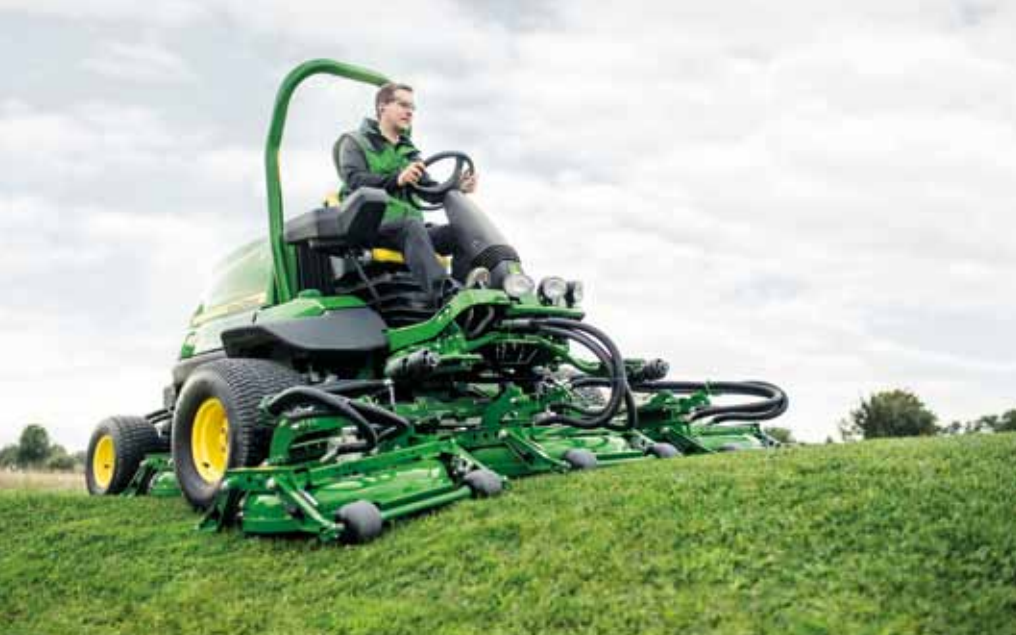
John Deere 9009A