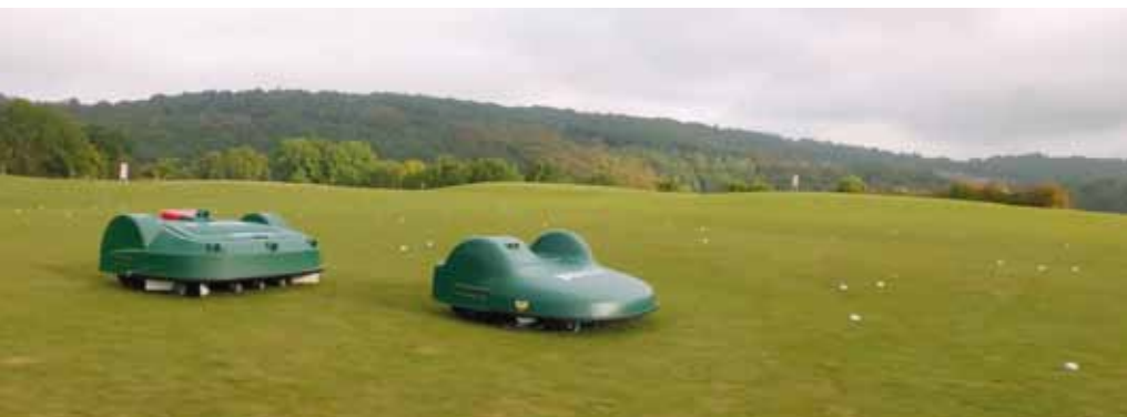
Team Bigmow en de Ballpicker in een line-up